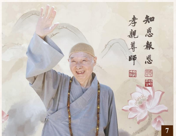
圖 7：知恩報恩，孝親尊師，老實念佛，我們極樂世界再見。