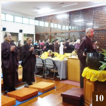
圖 10： 上 智 下 揚法師領眾念佛。