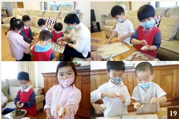
圖 19：老師教小朋友包餃子，寓教於樂。