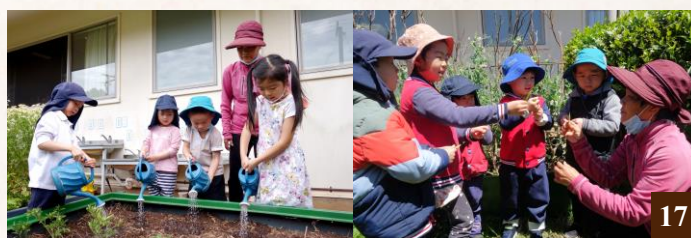
圖 17：親近大自然的戶外種植活動。