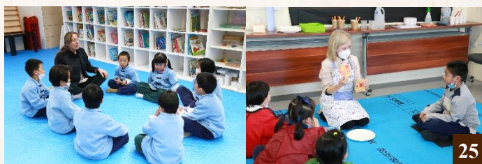
圖 25：學校採用澳大利亞教育課綱來設置課程。

學校安排專業的英語老師，對每一個學生的英文水平進行定期的測試和評估。以此對英文課的教學安排進行相應的調整，以區別教育的方式，最大程度的幫助學生提高英文成績。