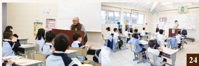
圖 24：學校以英中雙語教學，並提供德行課及宗教課。

行《弟子規》的作業。作業以積分獎勵的方式，鼓勵孩子將學校所學的孝道在家中執行。放學前的習勞課，老師根據孩子的年齡，佈置不同的習勞任務。對自己的教室、校園進行打掃，這不僅鍛鍊同學之間互助合作能力，還讓孩子知道勞動不易，學會感恩。