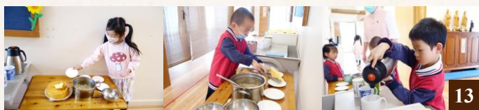
圖 13：教導同學們要為大眾服務。