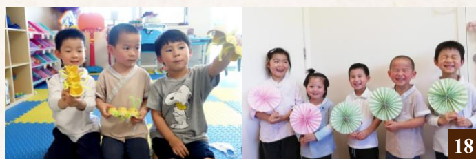
圖 18：孩子們學習製作手工作品，培養耐心，陶冶性情。