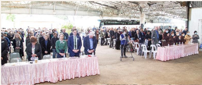
圖 30：大眾一起向老和尚表達誠摯的愛與感恩。