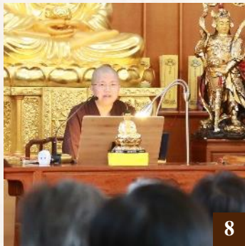
圖 8： 上 悟 下 全法師專題習講。

淨宗學院自成立以來，為遵循導師 上 淨 下 空老和尚的教誨，禮請法師長駐講經。每週一至週日，進行淨土經典之學習心得分享；部分課程及活動提供網路直播。