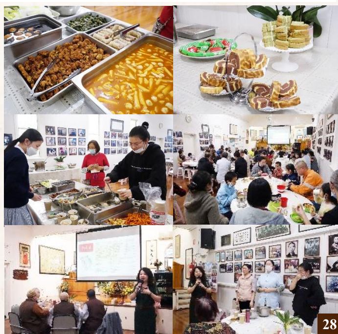
圖 28：酒店管理高級大專文憑學生於畢業前舉辦謝師宴；學生們準備多道素食料理，請淨宗學院的法師及大眾享用。