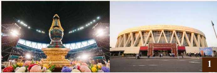
圖 1：圓寂傳供讚頌大典會場——林口體育館。

淨空老和尚畢生遵佛教誨，上行下化，開演十方諸佛同讚之淨土法門；提倡祭祖、祭孔，強調孝親尊師是世出世間一切法成就的根本；一生弘揚中華傳統倫理道德，振興漢字文言文，賡續文化命脈；心繫和平，提倡普世教育、愛的教育，廣泛團結宗教、族群，做出和諧示範。老和尚圓滿演繹「上報四重恩」，為我們做出了知恩報恩的最佳典範。讚頌大典旨在通過莊嚴的儀軌向老和尚致敬祝願，通過緬懷老和尚一生的殊勝行願，啟發我們學習、效法老和尚，盡未來際以「如說修行供養」，上報四重恩，下濟三途苦。