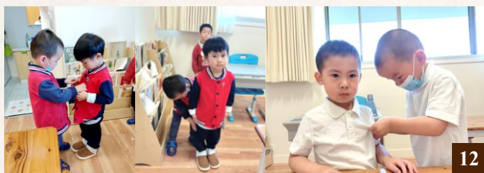
圖 12：兄弟互助，幫助新入園小朋友熟悉學校生活。

2022年7月，「幼兒小班」下半學年開始了。下半年的教學重點圍繞德行的持續培養，輔以豐富多彩的體能訓練、親近大自然的戶外種植，以及教同學們包餃子等活動。學校另有安排特別活動——「來自聖誕老人的禮物 孝心滿願行動」。