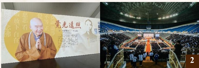
圖 2：入口的展板以精華的方式呈現了老和尚的生平與貢獻；現場來賓與網路前連線參與的大眾一道，共同緬懷讚頌老和尚畢生弘法利生的深恩與貢獻。