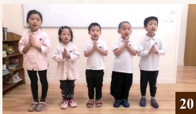
圖 20：孩子們共同吟誦《弟子規》中的〈入則孝〉和〈出則弟〉，為法師和老師們獻上祝福。

孩子們也為法師和老師們吟誦了《弟子規》，祝福敬愛的法師和老師們，及天下所有的老師聖誕節快樂、新年快樂。同學們整齊響亮的吟誦聲，為本學年劃上了圓滿的句號。