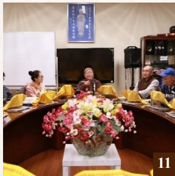
圖 11： 上 悟 下 莊法師專題習講。