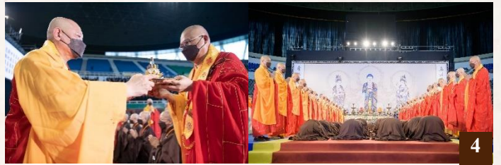
圖 4：三十二位諸山長老，率同法眷敬呈十供養，以表達對老和尚的無上禮敬。