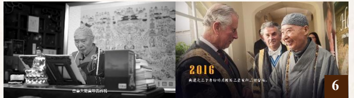
圖 6：學佛這一條路怎麼走？老和尚為我們演繹出來了——對老師百分之百地相信，依教奉行。