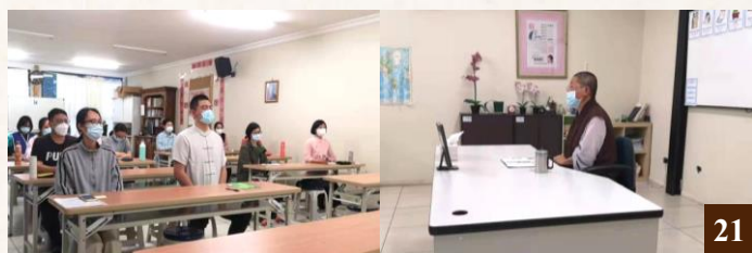
圖 21：淨宗學院持續舉辦一條龍教學培訓學習班。

本年度的教師共修，大家繼續聆聽淨空老和尚講解的《太上感應篇》，老和尚語重心長的開示和捨報西歸的示現，令弟子們體悟世事無常，愈發深信因果，勤修戒定慧，好好念佛求生淨土。