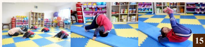
圖 15：經過數週的練習，孩子們的動作愈來愈嫻熟、流暢。

通過讓孩子們練習各式伸展、爬行、走跳、翻滾等運動，鍛鍊他們的肌肉力量，促進骨骼生長。幼兒運動不但能增強孩子們的身體平衡力、耐受力和手腳協調力，也能提高了他們自信心、知覺力及情緒調節的能力。