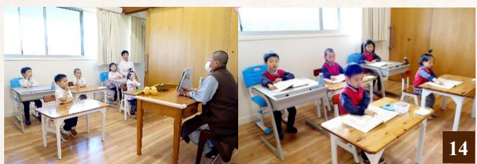
圖 14：孩子們專注地聆聽法師講述《德育故事》。

每週五，法師來校給同學們講孝道的故事。藉由講述古聖先賢的感人事跡，打動孩子們純淨的心靈，啟發他們回歸孝順父母的天性，並樹立希聖希賢、見賢思齊的遠大志願。法師和顏愛語，循循善誘，鼓勵孩子們在課堂上積極發言，講述自己在家做了哪些事讓父母高興，今後還能做哪些孝順父母的事情。