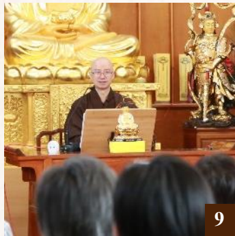
圖 9： 上 悟 下 勝法師專題習講。