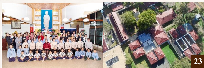
圖 23：明德學校的老師、學生及家長在校園中合影。

在入學和放學前，老師和學生們都會向孔老夫子行禮問安，以表尊師重道。孔子建構了完整的「道德」思想體系，明德依指孔夫子的經典和教學理念，致力於將學生培養成有德行的人。此外，老師會帶領學生念阿彌陀佛名號，使他們心平氣和，降服習氣，開啟智慧。