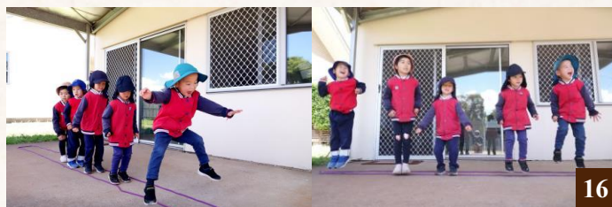
圖 16：老師設計的繩子遊戲變化無窮，歡笑聲不絕於耳。