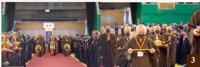
圖 3：時空的界限驀然而逝，老和尚慈悲的身影彷彿徐徐步入會場。