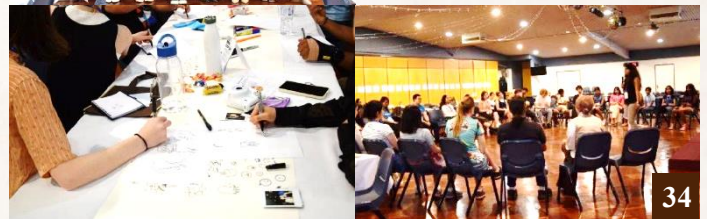
圖 31：參與和平論壇的各宗教及文化代表於活動中合影。